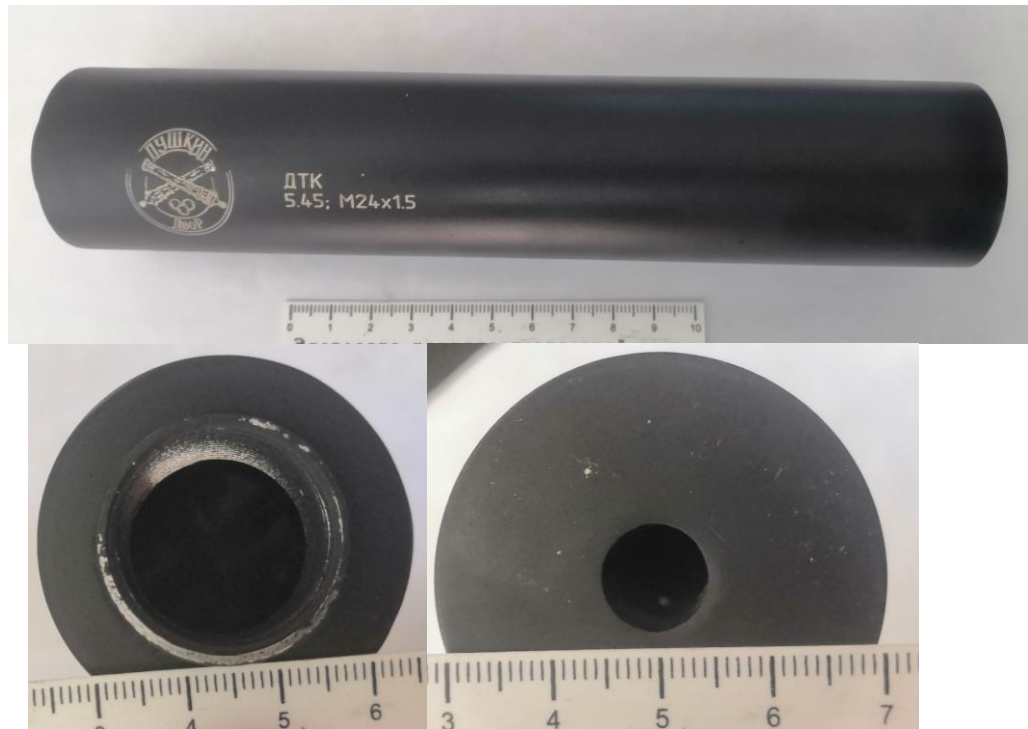
Фото №1. Общий вид и торцевые поверхности ДТК 5.45 М24х1.5 «Пушкин двор»